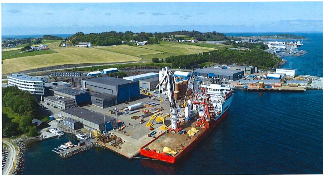
Figur 1 - Anlegget, Harestadvika – Juni 2023

Randaberg Group tar samfunnsansvar på alvor og har iverksatt kravene i henhold til Lov om virksomheters åpenhet og arbeid med grunnleggende menneskerettigheter og anstendige arbeidsforhold (Åpenhetsloven). Aktsomhetsvurderinger er gjennomført, og arbeidet vil fortsette med jevnlige oppdateringer.